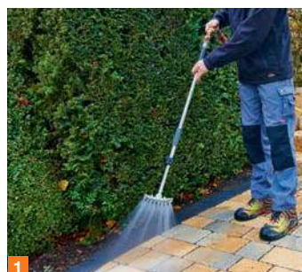
1 Предварительное увлажнение